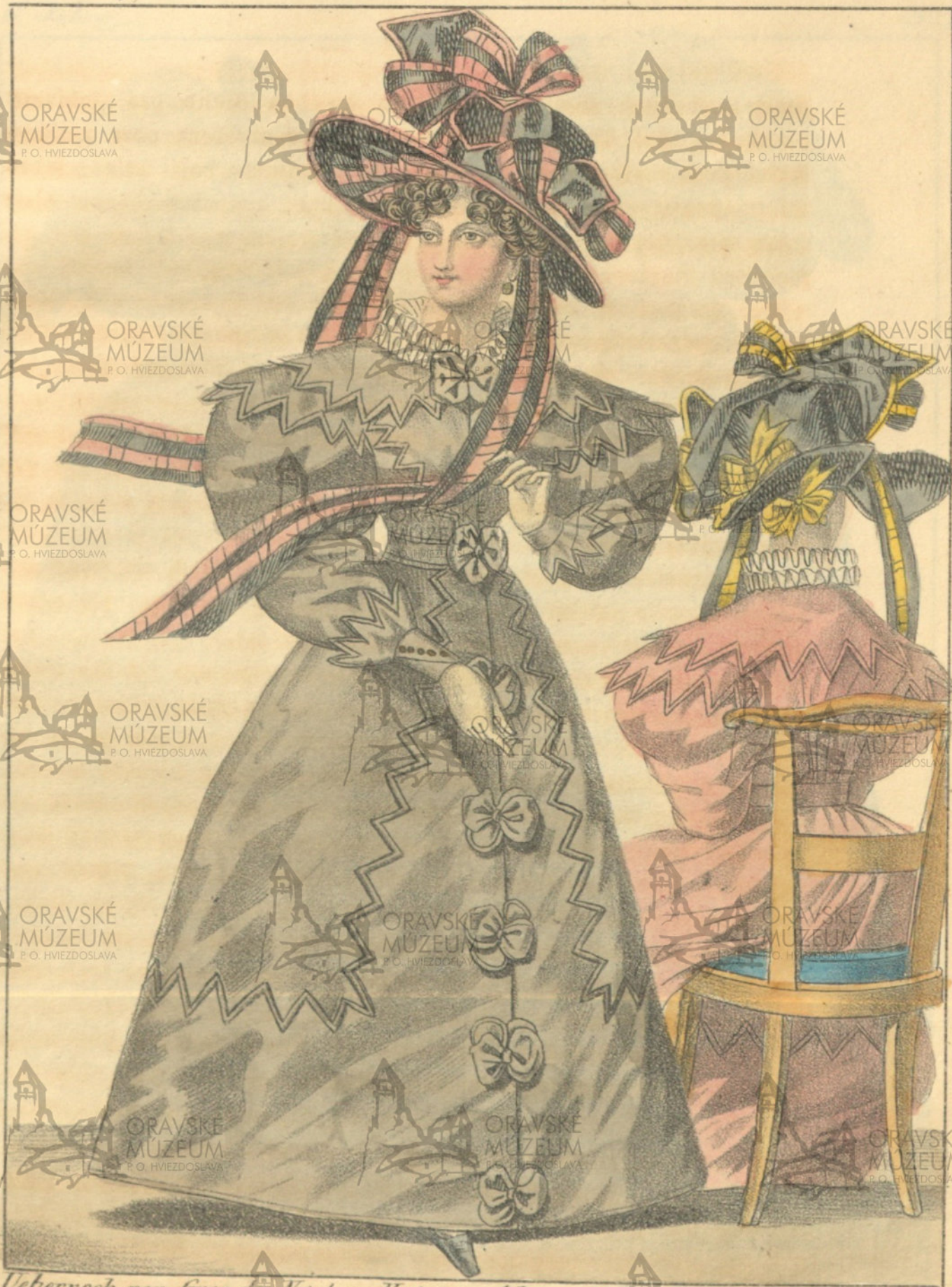
Deberrock von Gros de Waples. Hut von Atlas mit Bändern.